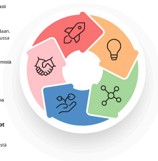
Leikin merkitys varhaiskasvatuksessa