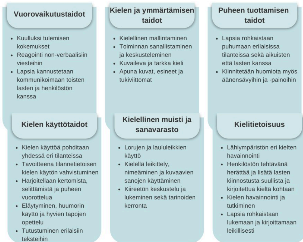
Kehittyvät kielelliset identiteetit